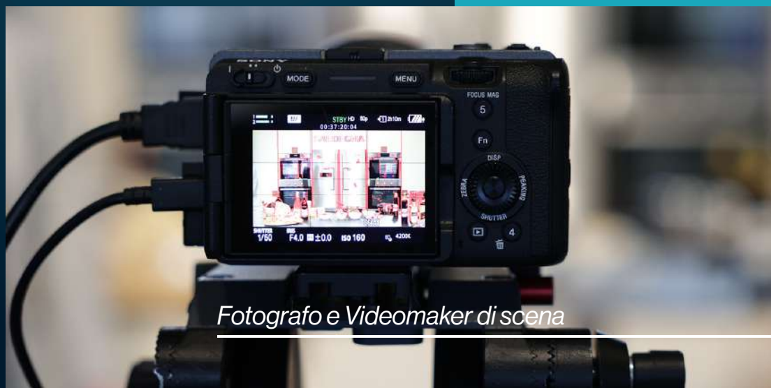
Fotografo e Videomaker di scena

Il corso mira a preparare professionisti dell'editing foto e video che sono sempre più richiesti dal mercato del lavoro perché questo è uno dei settori lavorativi più in espansione in quanto, oltre ai lavori prettamente "da set", è composto da diverse sottocategorie ad esso collegato: wedding e varie tipologie di feste; settore audiovisivo e industria di lungometraggi, mediometraggi e cortometraggi; spot pubblicitari e operazioni di marketing; videoclip musicali; realizzazione di backstage e racconto post-evento. È fondamentale l'apprendimento delle regole e degli strumenti per realizzare timeline ordinate e narrazioni funzionali allo scopo da raggiungere.