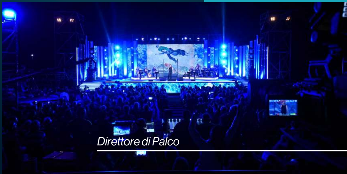
Direttore di Palco

I Corso è fondamentale per chi intende intraprendere il mestiere di Direttore di palco, una figura strategica e indispensabile in ogni tipo di spettacolo. Il Direttore di palco è il professionista che decide, coordina e sovrintende a tutte le attività, tecniche e di servizio, propedeutiche non solo alla realizzazione del prodotto ma anche al suo successo. Egli lavora in modo autonomo, con le proprie competenze, e in stretta sinergia con tutti gli altri comparti, dalla regia alla direzione musicale o alla direzione del ballo; in ogni caso, è preparato a risolvere problemi e imprevisti, favorendo il lavoro di squadra.